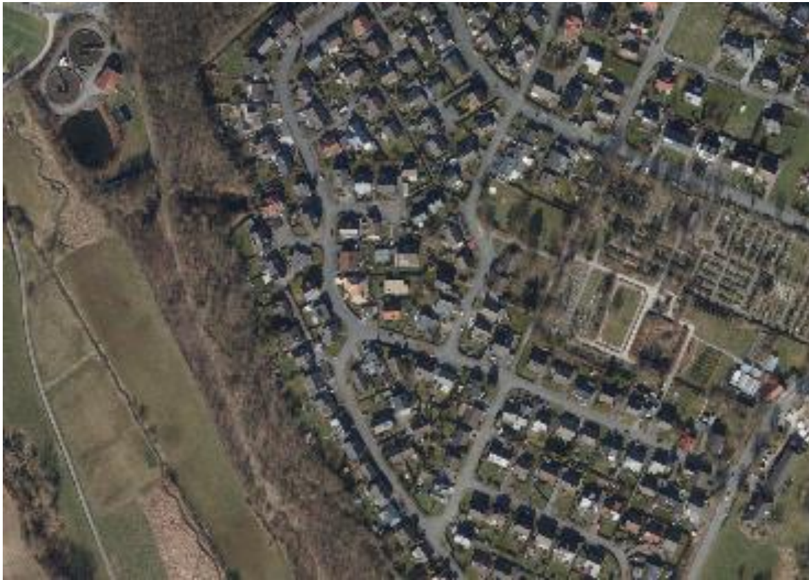
Abbildung 5: Aktuelle Flächennutzung des Änderungsbereiches

eine evtl. Gehölzreduzierung nicht während der Brut- und Aufzuchtzeiten, also zwischen dem 01.03. bis zum 30.09. eines Jahres, erfolgt.