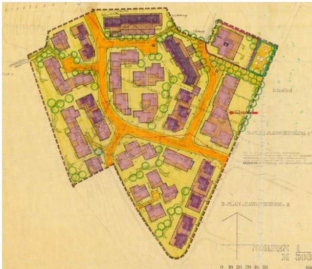
Abbildung 4: Plangebiet innerhalb des bestehenden Bebauungsplanes Nr. 24 „Rauschenberg 3“