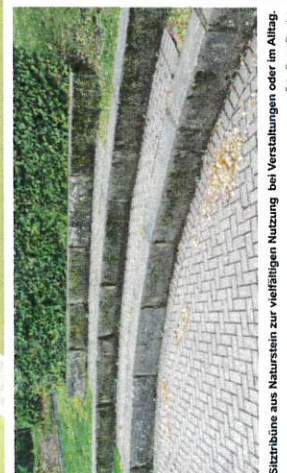
Sitzbänke aus Naturstein zur vielfältigen Nutzung bei Veranstaltungen oder im Alltag.