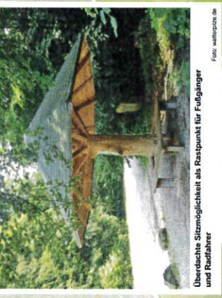
Überdachte Sitzmöglichkeit als Rastpunkt für Fußgänger und Radfahrer