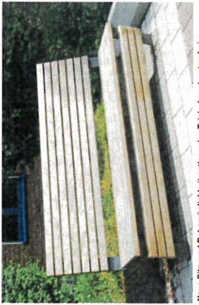
Neue Sitz- und Ruhmöglichkeit entlang des Teichufers, barrierefreie Erschließung von der Westseite