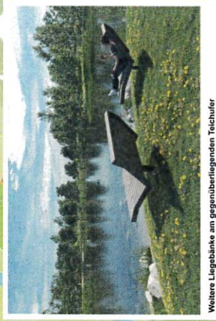
Weitere Liegebänke am gegenüberliegenden Teichufer in Sichtbeziehung