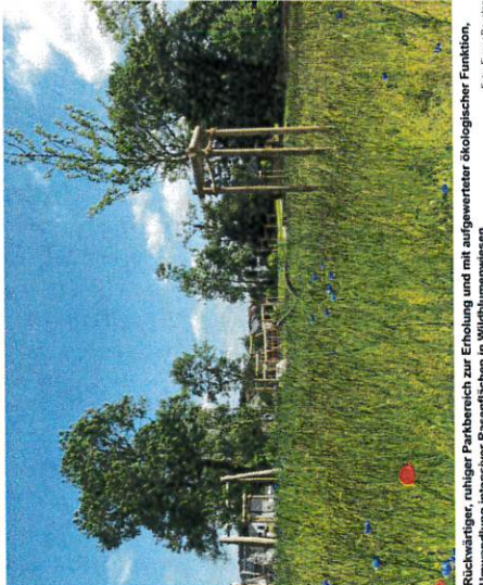
Rückwärtiger, ruhiger Parkbereich zur Erholung und mit aufgeweilter ökologischer Funktion, Umwandlung intensiver Rasenflächen in Wildblumenweiden