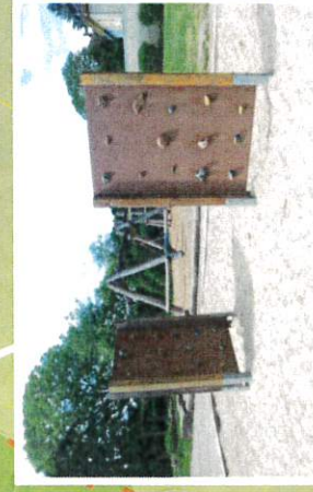
Neue Spray- und Kletterwände zur Ergänzung des Blikeparks